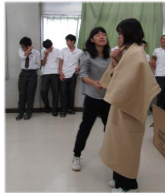
各種リラクゼーション説明状況