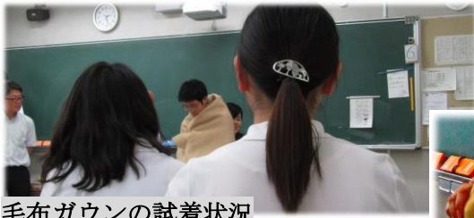
毛布ガウンの試着状況