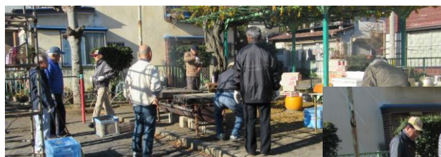
焼き芋／芋煮調理状況