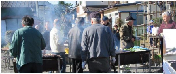
バーベキュー調理状況