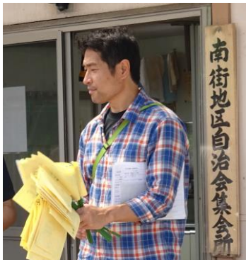
安否確認訓練の結果報告 (77世帯中、68世帯の安全を確認)