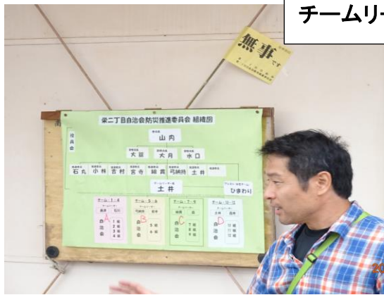
チームリーダー長による訓練の説明。