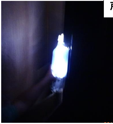
戸棚の中でも明るい。