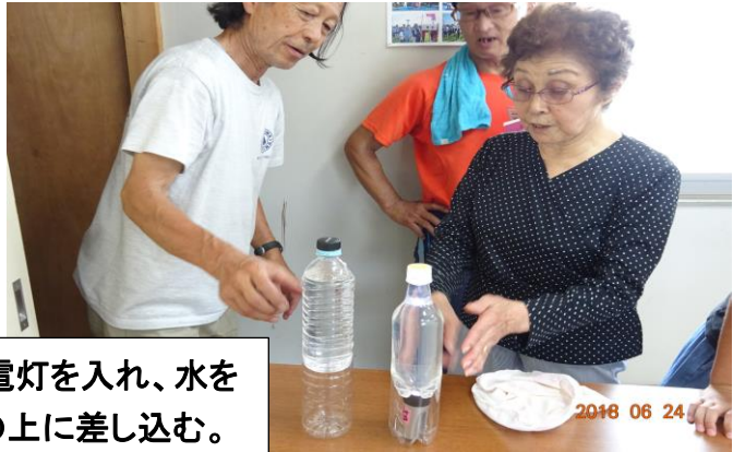
ペットボトルの下半分に懐中電灯を入れ、水を入れた別のペットボトルをその上に差し込む。