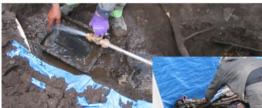
バルブ及び水道メータの取り付け作業