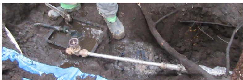
ステンレスの新管