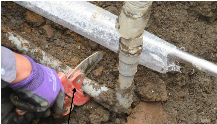
仮本管と暫定接続屋内配管との切断作業状況