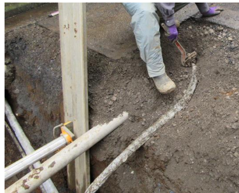
本管と屋内配管接続全体状況