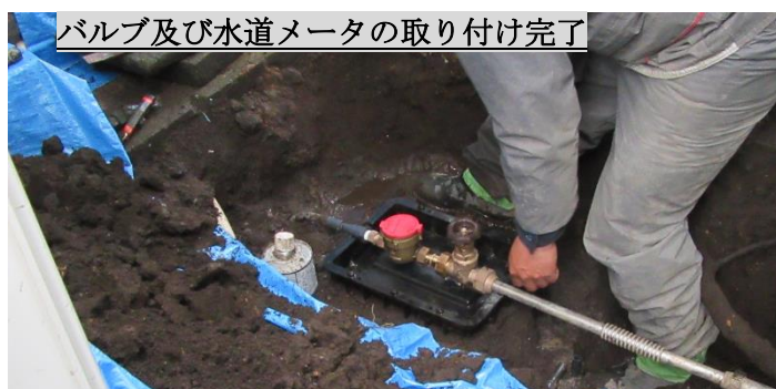
バルブ及び水道メータの取り付け完了