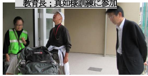
教育長；真如様訓練に参加