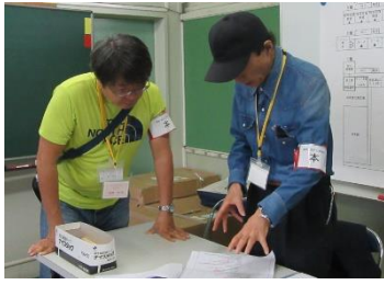
教室の点検作業中