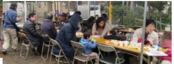
ビンゴゲームの開催状況