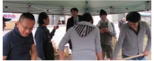
参加者の歓談状況