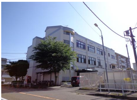
上北台市民センター外観

公民館では、音楽活動や健康体操、パソコンサークルなど、様々なグループが活動しています。また講座から自主グループになって新たに活動を始めるグループもあり幅広い分野に及びます。 皆さんも、参加してみたいと思うグループがあれば、公民館にお越しください。 見学も可能ですので、お問合せください。