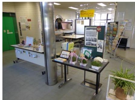
上北台市民センター1階ロビーの様子