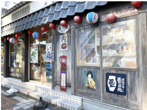
青梅駅前 昭和レトロな店