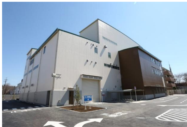
エコプラザ・スリーハーモニー