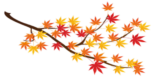
清流ガーデン澤乃井園にて