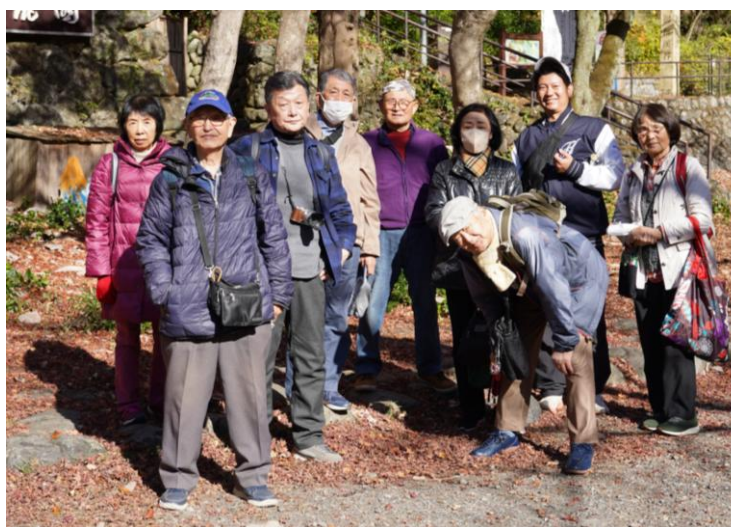
参加者のみなさん