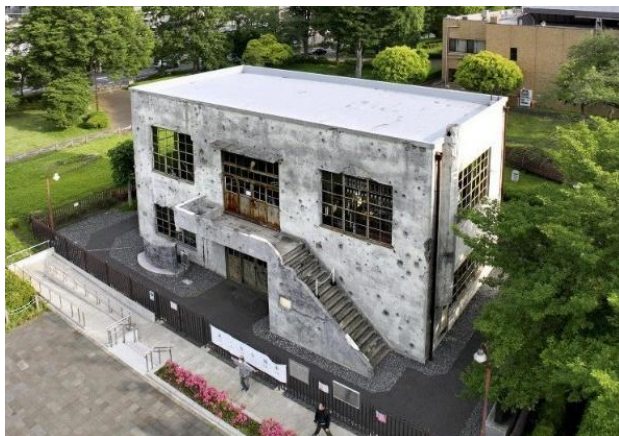
旧日立航空機立川工場変電所