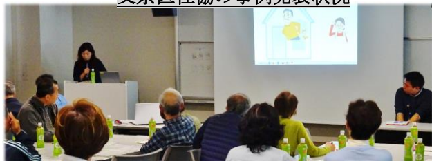
文京区社協の事例発表状況