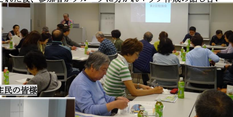
参加の地域住民の皆様