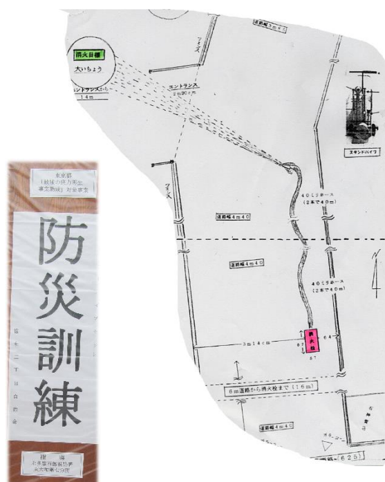
東大和市消防団第七分団隊員によるスタンドパイプ基本説明