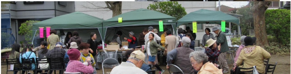
クップで遊ぶ子供達