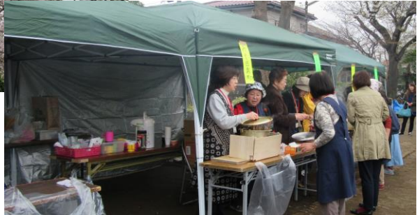
売店のレイアウト