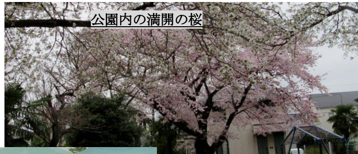
公園内の満開の桜

午前9時頃まで霧雨が降っておりましたがその後止んだ為、予定通り桜祭りが開催出来た様です。公園の桜は満開で自治会の多数会員の皆様参加があり、桜祭りを大いに楽しんでいる様子でした。南街・桜が丘地域防災協議会本部として本桜祭りに参加しましたので以下報告致します。