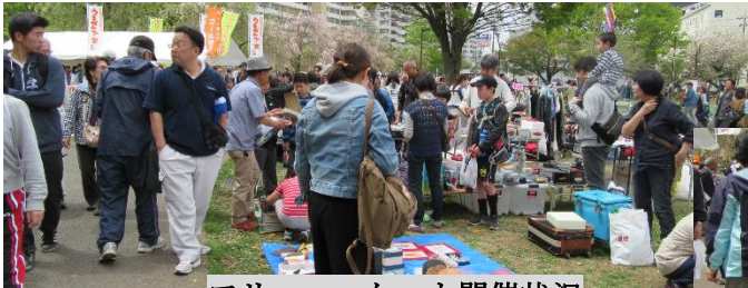
フリーマーケット開催状況