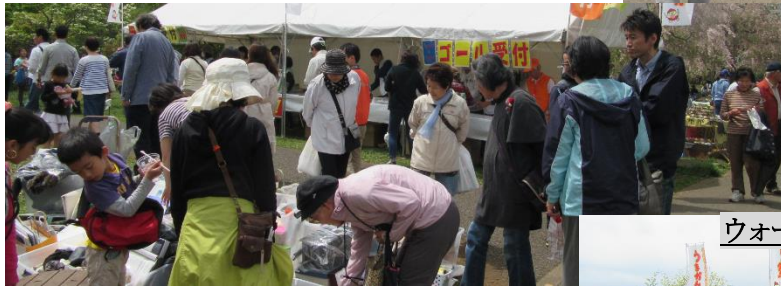
ウォーキングゴールテント