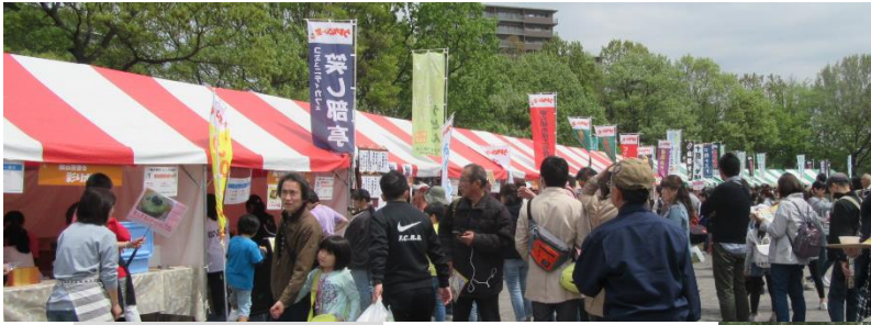
出店及び参加者状況