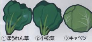
①ほうれん草 ②小松菜 ③キャベツ ④狭山茶 ⑤茶うどん