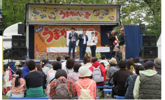
東大和市社協のたまちゃん