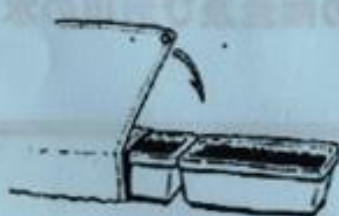
グラタンとレジヤシート