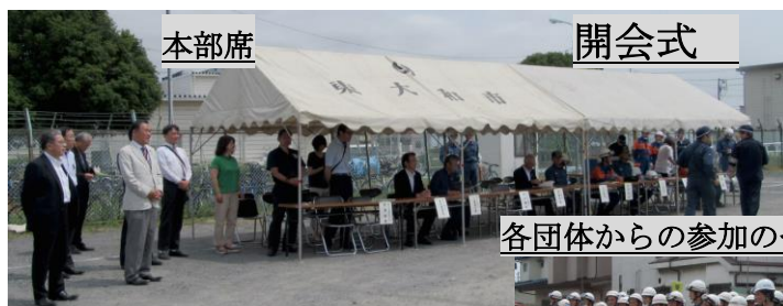
各団体からの参加の皆様