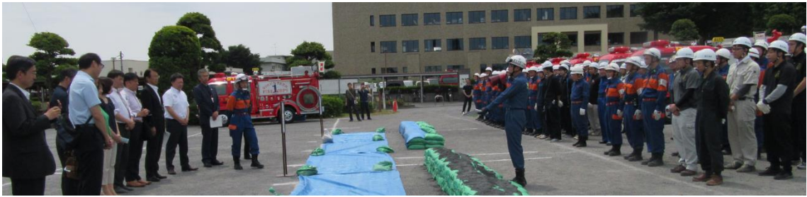
マンホール噴出防止工法