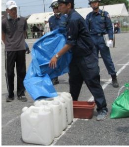
ポリタンクを利用した簡易土嚢の作り方