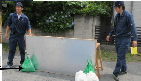
土嚢の使用(固定用)