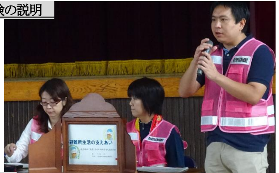
東大和市社会福祉協議会のご指導