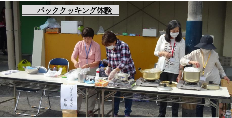
バッククッキング体験