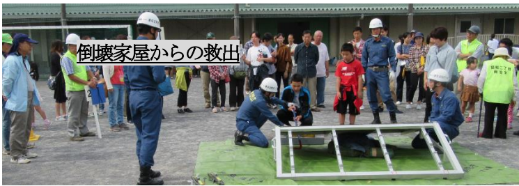
倒壊家屋からの救出