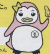
更生ペンギンのサラちゃん