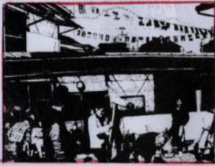
小さいけれど 青空にたなびく万国旗

「ヨイショーヨイショー」の掛け声 幼い子供や低学年のお子さんと一緒に親子連れ、新しく入会したパパも笑顔で挑戦、ぎこちない振り降しが終わる頃にはベテラン指導者から75点の免許皆伝を頂いた。