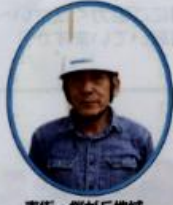
南街・桜が丘地域 防災協議会副本部長