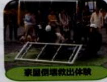
家屋倒壊救出体験