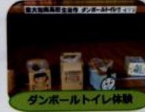
ダンボールトイレ体験