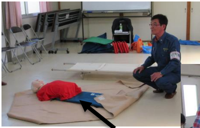
担架の操作方法訓練