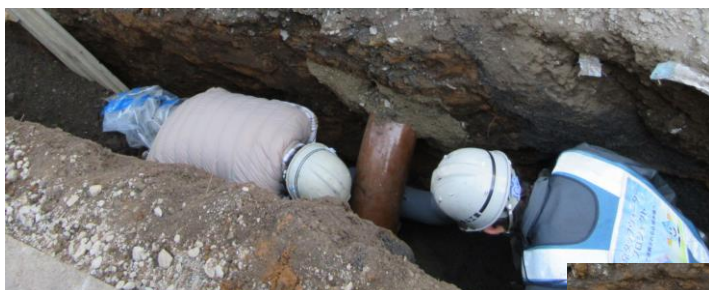
本管埋設工事状況(下水管との交差を屈曲管で対応)