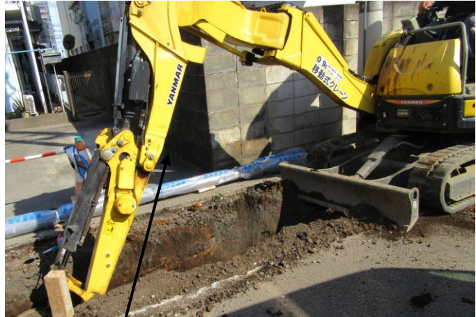
掘削に使用の重機