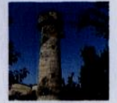
元日立航空機工業(株) (変電所側の給水塔)