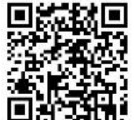
「うまかんべえ~祭」ホームページQRコード

【問い合わせ・申し込み先】 東大和産業振興課 電話:042-563-2111 (内線1074)