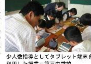
少人数指導としてタブレット端末を利用した授業＝第三中学校

社会の変化が加速度を増し、複雑で予想困難となっている近年、これからの時代に求められる教育がどのようなものかを、私たち大人は考えていかなければなりません。