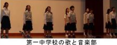
第一中学校の歌と音楽部