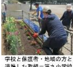
学校と保護者・地域の方と連携した取組＝第九小学校

今年度のテーマは、「翔(かける)」子供が空を翔るよう飛躍してほしいという願いをこめてです。