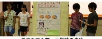
発表をする第一小学校の生徒