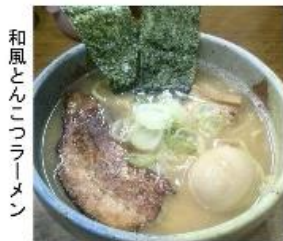
和風とんこつラーメン

まだまだ寒いこの時期に食べたくなるのがやっばりラーメン。そこで今回は、東大和でお店を開いてから今年で13年になる「とんがら亭」さんのご紹介です。