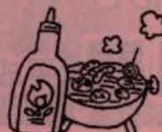
アウトドア用 助燃剤