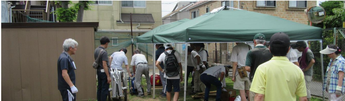
その他所有資機材類(今回は猛暑の為、操作訓練は実施せず)