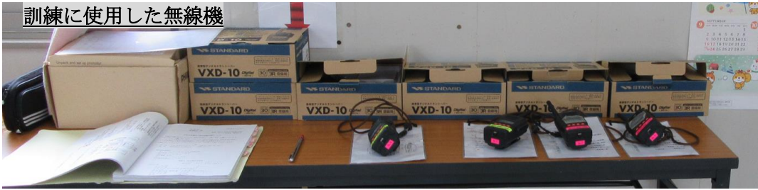
訓練に使用した無線機