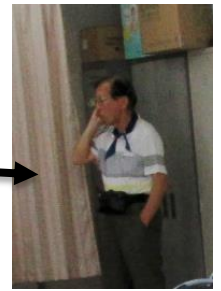
4つのグループ及び第一光ヶ丘自治会間による交信状況