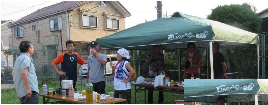
外部での焼肉等の作業状況