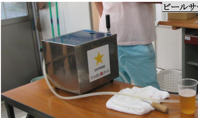
ビールサーバーの用意