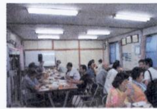
鉄板(電気)を持ち込んだ餃子 焼き方様々ですが この席での 焼きたて餃子 美味しいと好評