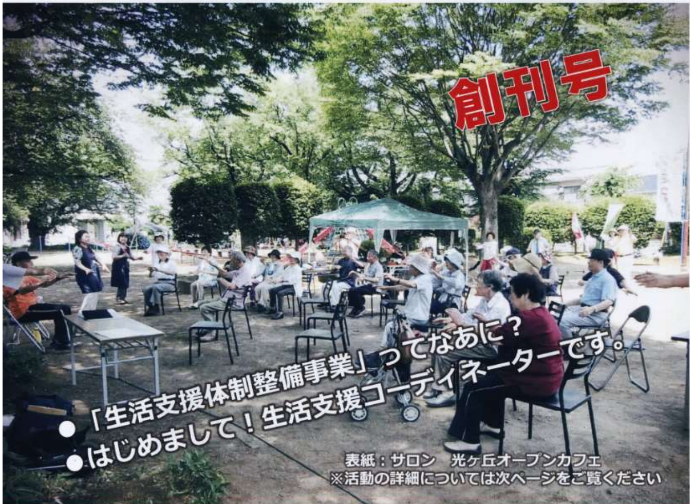
表紙：サロン 光ヶ丘オープンカフェ ※活動の詳細については次ページをご覧ください

この広報紙は、市民のみなさん一人ひとりが手を取り支え合うまちづくりを目指して「てとてとて」と名付けました。