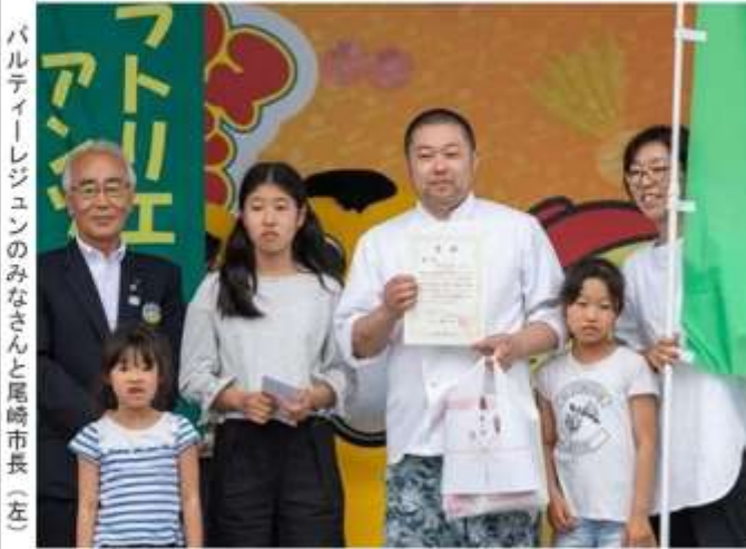
パルティージェジュンのみなさんと尾崎市長(左)