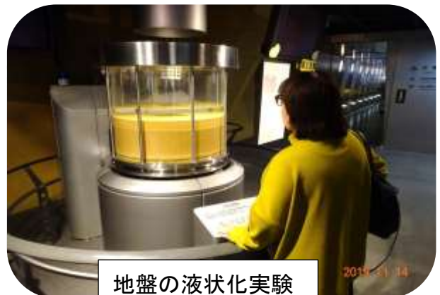
地盤の液状化実験