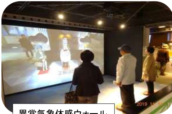
異常気象体感ウォール (クイズの正解はAかB かを答える。)