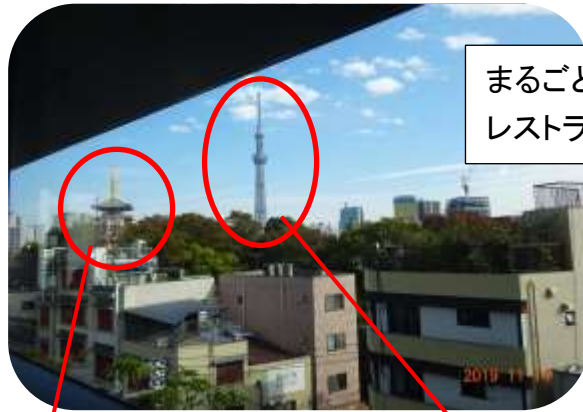
まるごとにつぽん4Fの レストランからの景観。