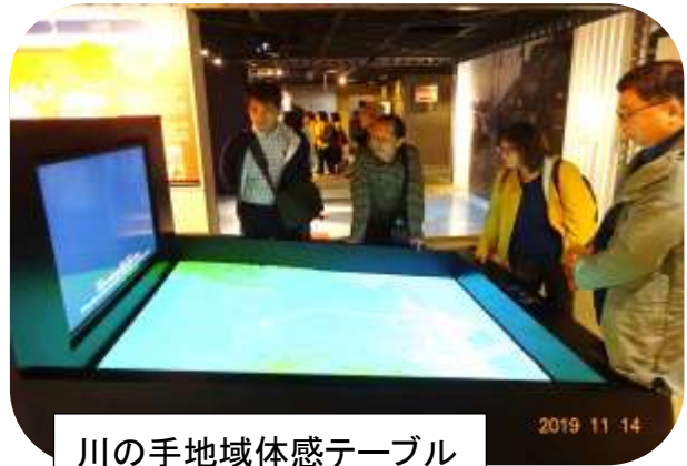
川の手地域体感テーブル (川に近い場所で起こる 災害を学ぶ。)