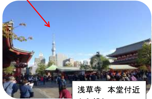
浅草寺 本堂付近 から望む。