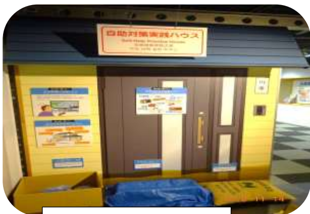
自助対策の実践ハウス