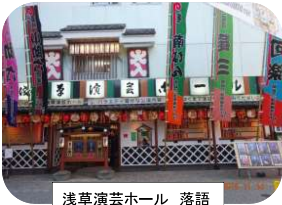
浅草演芸ホール 落語