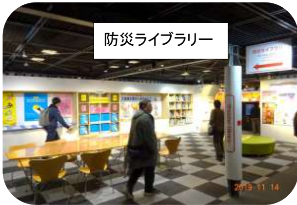
防災ライブラリー