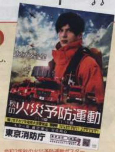
令和2年秋の火災予防運動ポスター