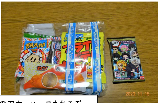
鬼滅の刃ウェハースもあるぞ。