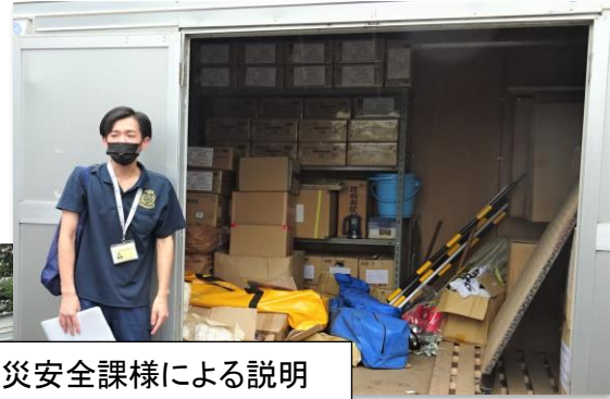
防災安全課様による説明