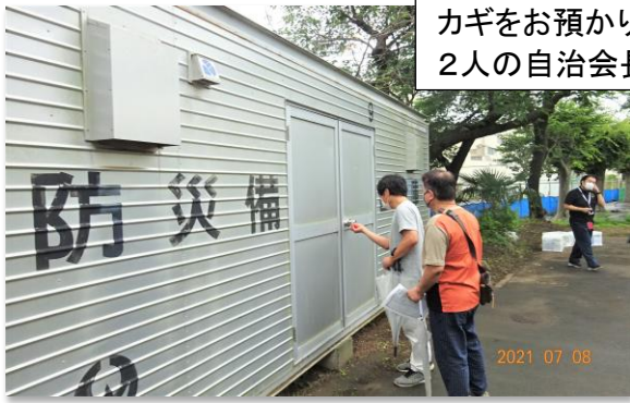
カギをお預かりしている、 2人の自治会長様による開錠。