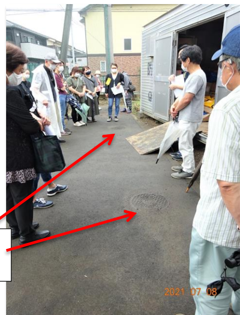
設置されているマンホールトイレ用 マンホール(5か所)。