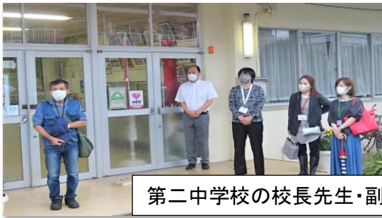
第二中学校の校長先生・副校長先生・PTA の皆様