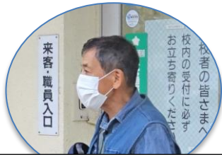
南街・桜が丘地域防災協議会 本部長 ご挨拶