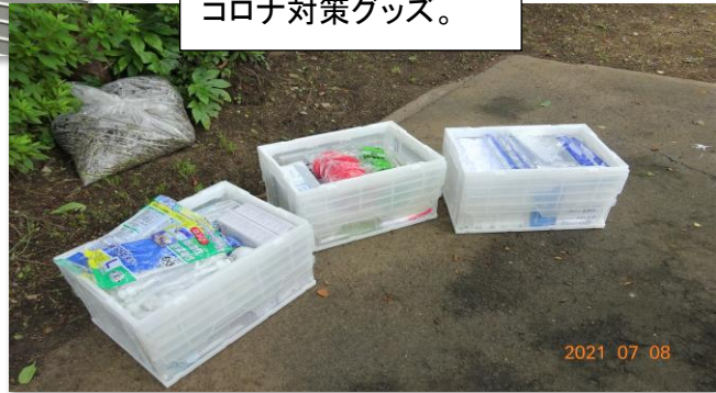
収納を予定している、 コロナ対策グッズ。