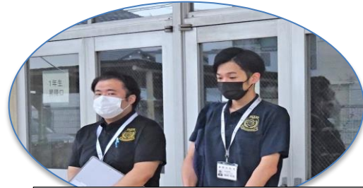
ご説明をして頂いた 防災安全課様