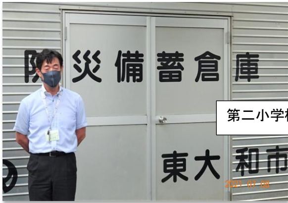
第二小学校 校長先生