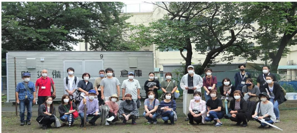
第二中学校防災備蓄倉庫前で 参加の皆様