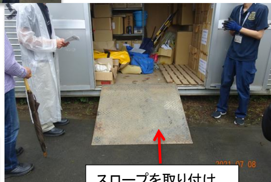
スロープを取り付け。