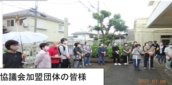
第二小学校 PTA・当防災協議会加盟団体の皆様