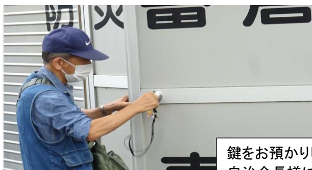
鍵をお預かりしている 自治会長様による開錠。