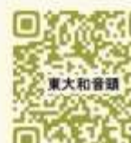
↑東大和音頭のYouTube動画