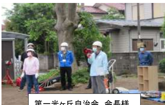
第一光ヶ丘自治会 会長様