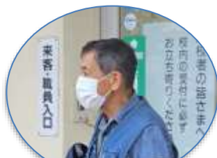
南街・桜が丘地域防災協議会 本部長 ご挨拶