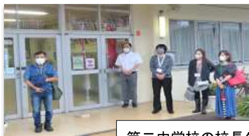
第二中学校の校長先生・副校長先生・PTA の皆様