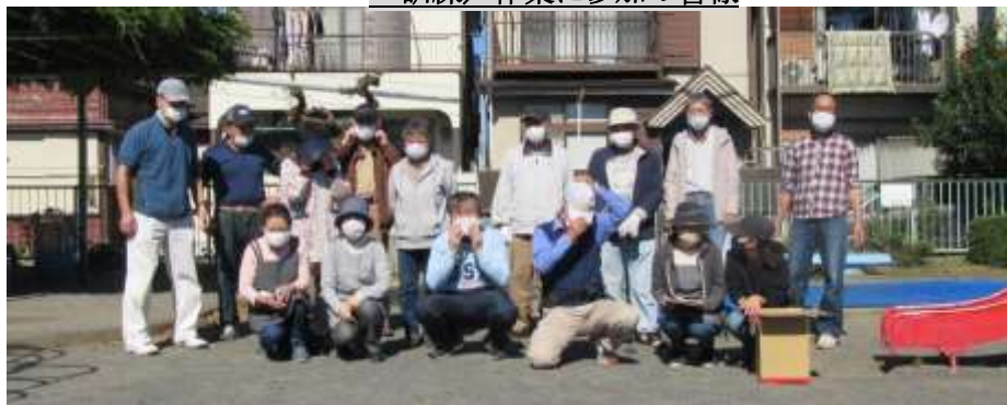
訓練／作業に参加の皆様