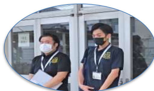
ご説明をして頂いた 防災安全課様