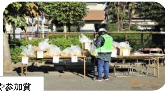
ヘルメットや参加賞