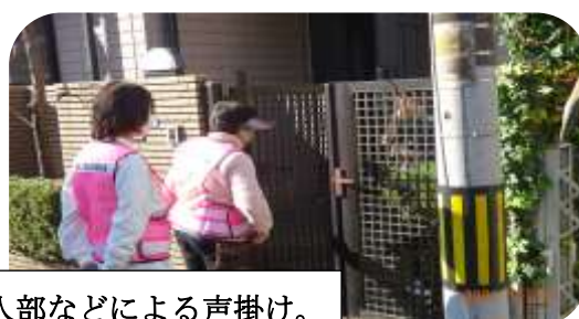
各班ごとに、婦人部などによる声掛け。