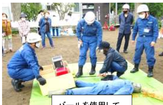
ボールを使用して