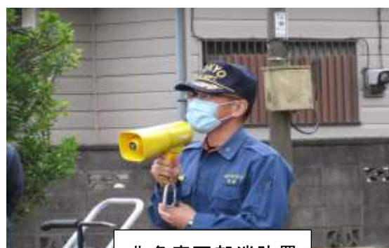
北多摩西部消防署 警防課 課長様