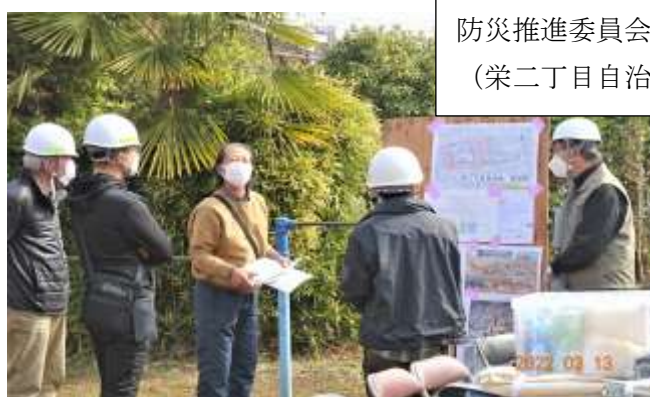
防災推進委員会 副委員長 様 (栄二丁目自治会 会長)