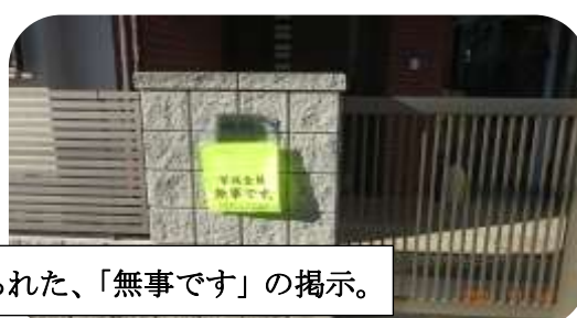
各参加会員自宅に掲げられた、「無事です」の掲示。