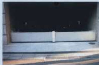
長い板を使った止水板