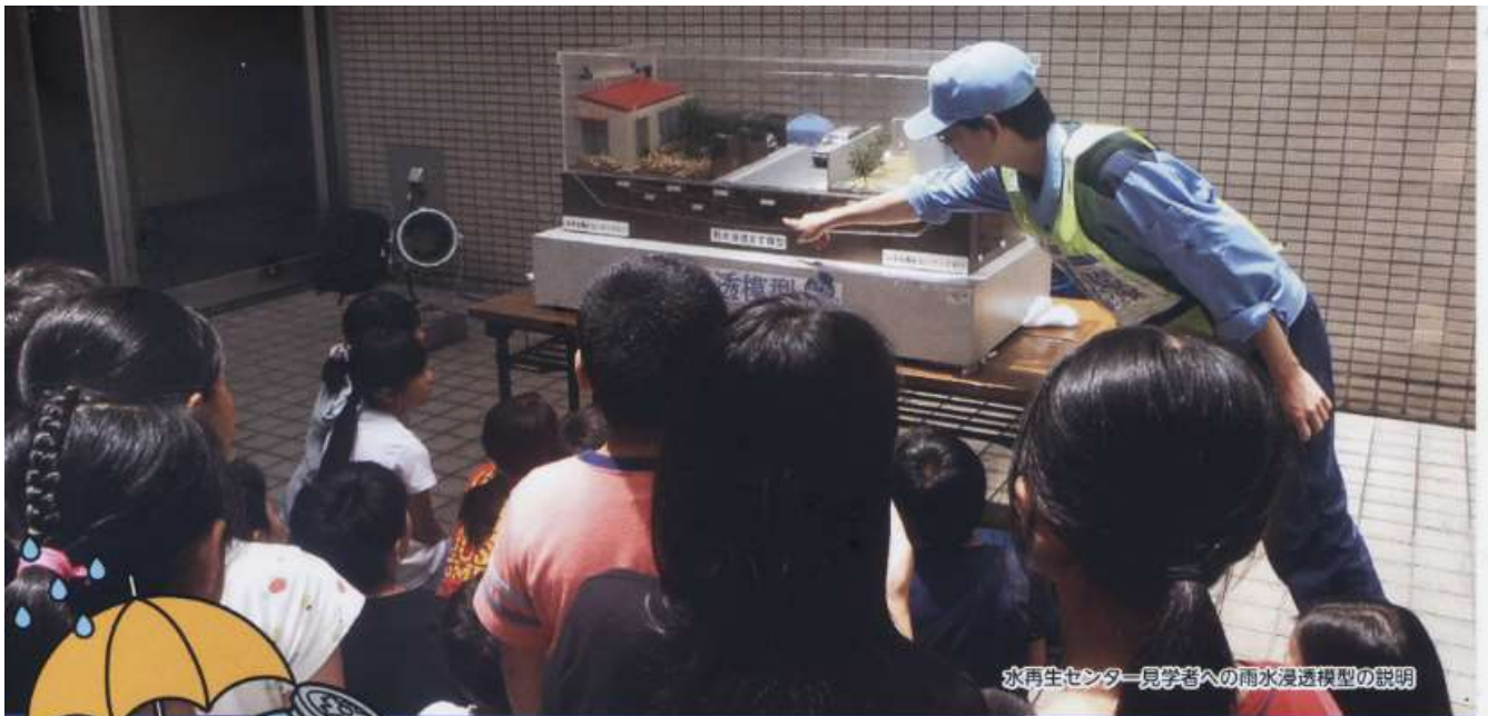
水再生センター見学者への雨水浸透模型の説明