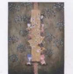
森のフェスティバル

作品名 (展示場所) ① 森のフェスティバル(店内壁) ② 見守る(店内壁) ③ あなたに届け(店内壁) ④ 出合い(ショーウィンドウ) 住所・営業時間・定休日 東大和市南街3-55-8 9:00~15:00