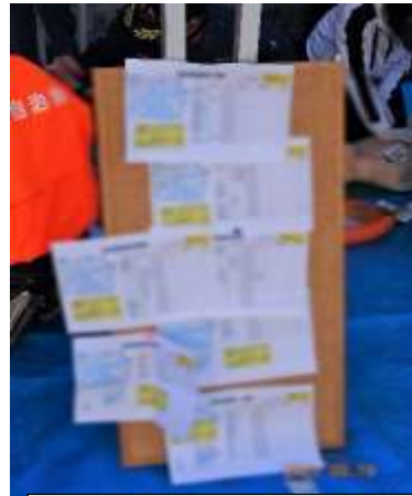
安否確認結果集計