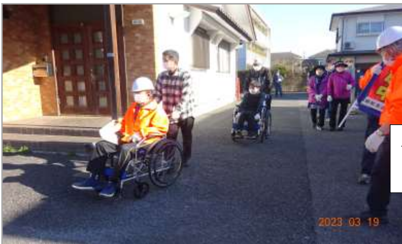
ハミングホールに向けて出発