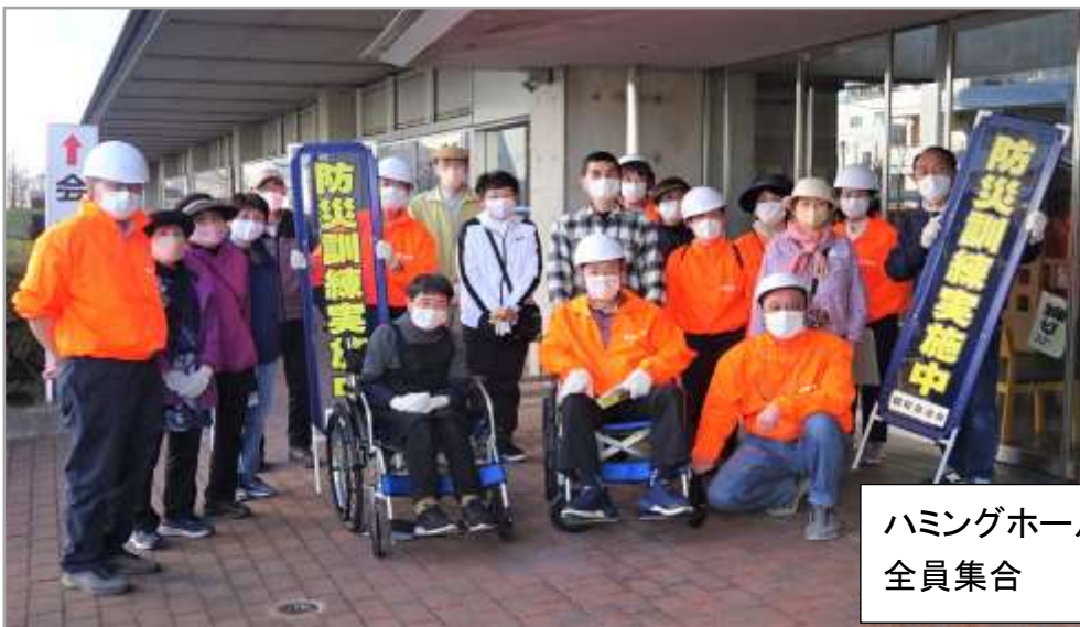
ハミングホールにて 全員集合