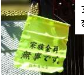
玄関先の「無事旗」を確認。