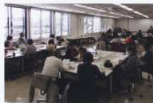
グループワークの様子 積極的な情報、意見交換がなされました。