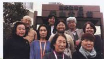
さやま・しみず楽しみたいのメンバーです！

活動日：毎週木曜日 時間：10:00～10:30 場所：狭山神社境内 内容：東大和元気ゆうゆう体操