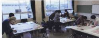
前回の介護予防リーダー養成講座の様子

介護予防に関する知識と技術を習得し、地域に根差した活動を行える人材を育成します。 2年に1度開講しています。