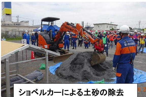
ショベルカーによる土砂の除去