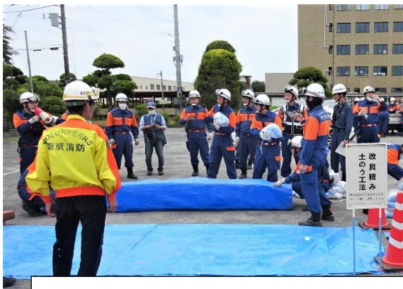
土のうをブルーシートで包み込み