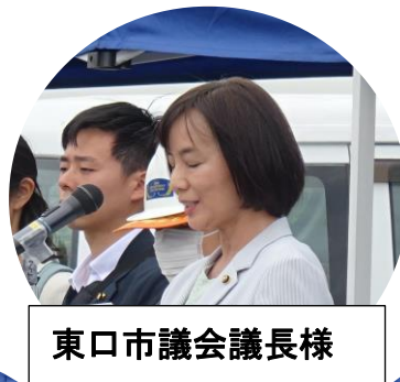
東口市議会議長様