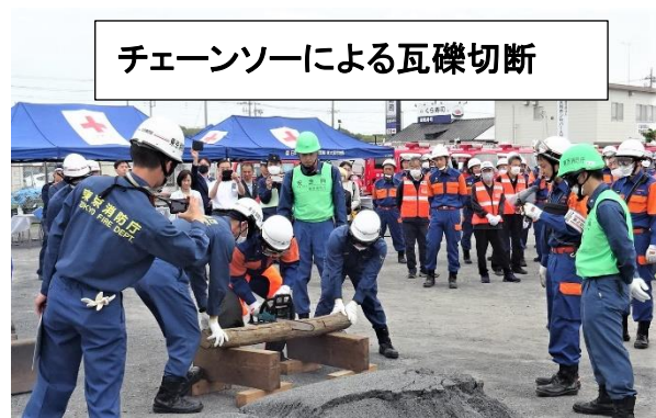
チェーンソーによる瓦礫切断