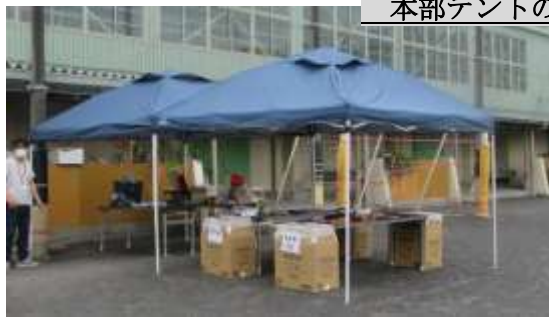
本部テントの設営