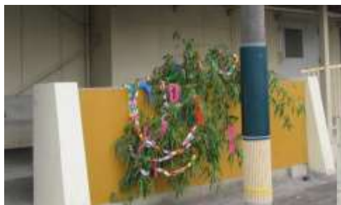
七夕飾りの設置状況