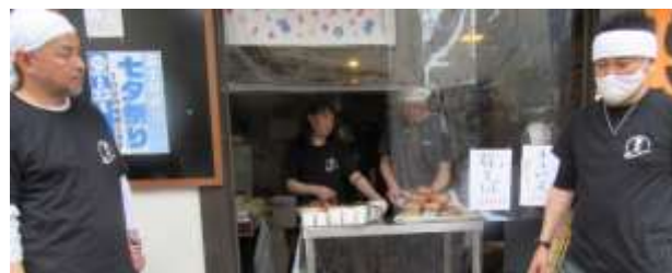
(10) 花の店けむりやま