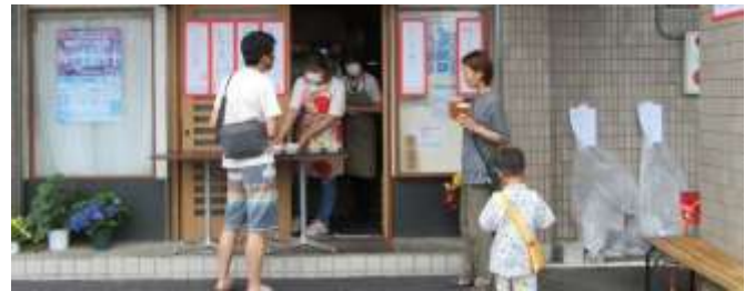
(21) マルヤマ衣料ショップ