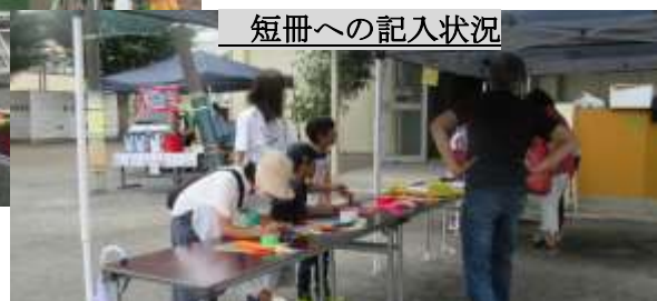
短冊への記入状況