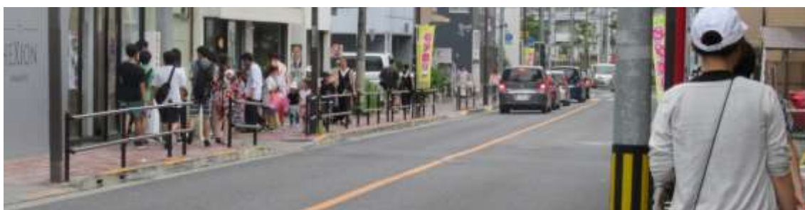
(17) フラワーショップ Hanana