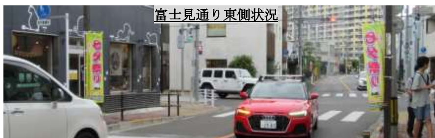
(24) Get happy