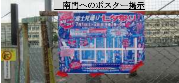
南門へのポスター掲示

本部のレイアウトは下図の通りで、降雨のおそれがあった為、「七夕飾り」の校庭内の展示は実施せず、体育館東側の渡り廊下に設置して、参加者には短冊を取り付けて戴きました。