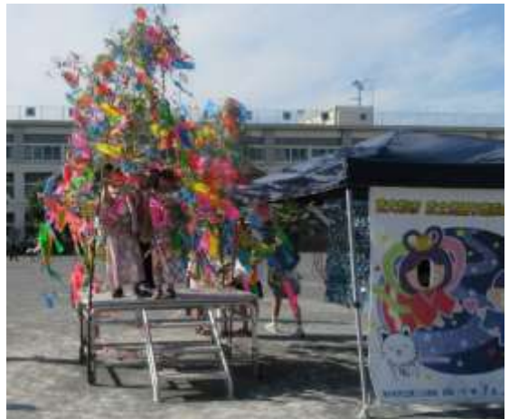
七夕飾りは校庭に設置されました