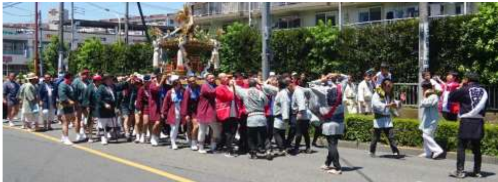
南街四つ公園到着直前の御神輿