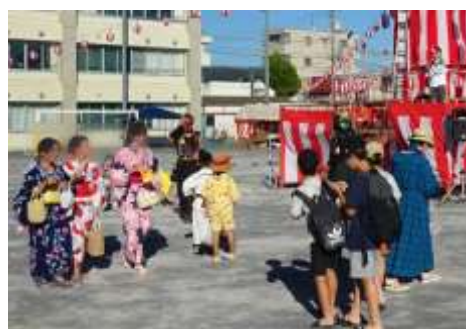
(l) (校庭) 和太鼓演奏 東大和高校和太鼓部 11:00-11:30