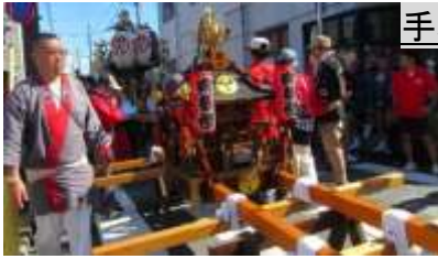
手塚寝具店横で休憩中