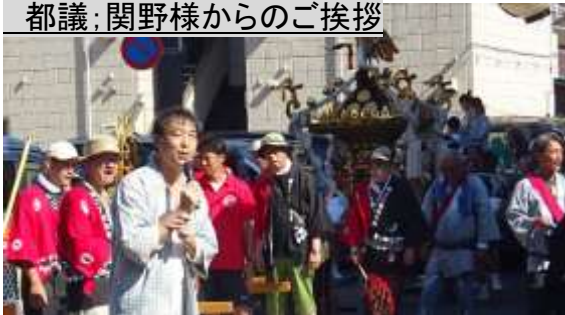
都議; 関野様からのご挨拶