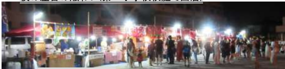
新海道公園で出店