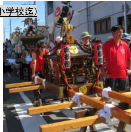
「子ども御神輿」の出発、続いて「南街睦御神輿」も出発