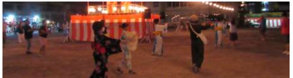
夜の屋台の賑わい(第二小学校校庭で出店)