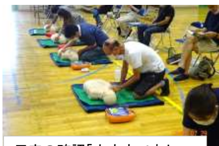
反応の確認「大丈夫ですか」