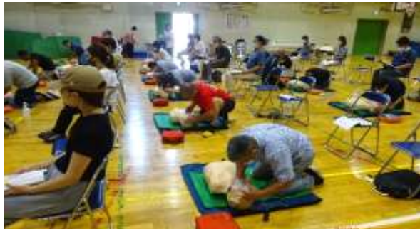
人工呼吸(感染予防の為、「口対マスク」をつけて)