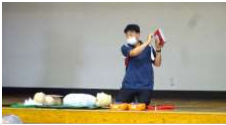
オートショックの AED もあります。 (自動的に電気が流れる。)