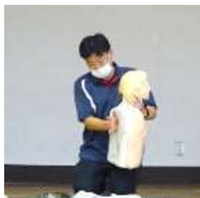
背部叩打(こうだ)法