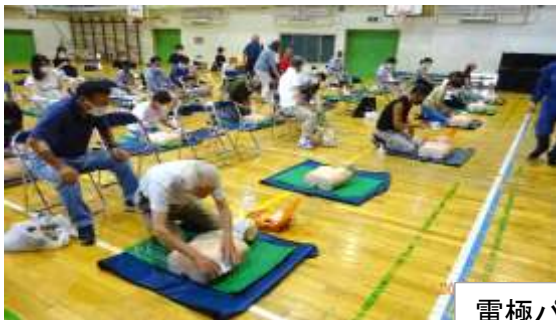
電極パットを貼る