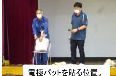
電極パットを貼る位置。 はだかにすること。 はがさないこと。