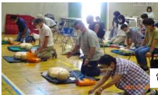
電極ショック実施(離れて下さい)