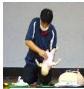
幼児に対する 胸部突き上げ法