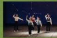
HYBC (東大和バトクラブ)