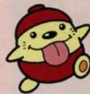
東大和市観光キャラクター うまべえ

午後の部は、4チーム対抗の運動会を実施するべし～ 1位のチームには、素敵な景品をご用意しているべし～