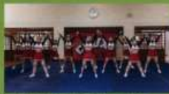
東京都立東大和高等学校 チアリーディング部 CRUX