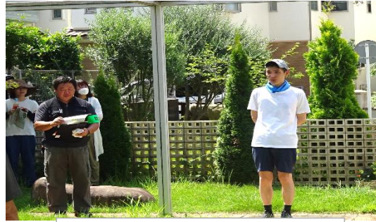
プラウド地区自治会会長様 活動終了の挨拶。