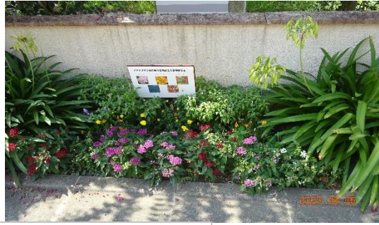
ハンカチの木公園の花壇 市の花植活動に協力されています。