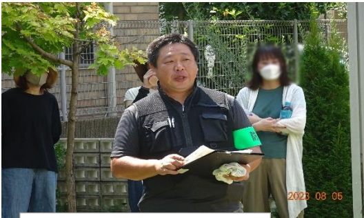
東大和警察署様による 還付金詐欺の防犯講習。