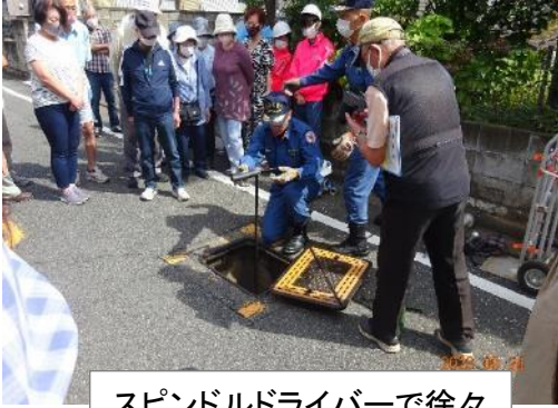
スピンドルドライバーで徐々に水を流し、さび抜き。