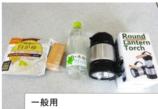
一般用 「関東大震災 100 年町会・自治会防災力強化助成金」による 災害用ランタンを含む。