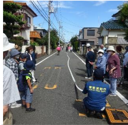
スタンドパイプに、20mホース4本をつなげ、伸展済。