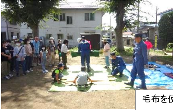
毛布を使用してのタンカ