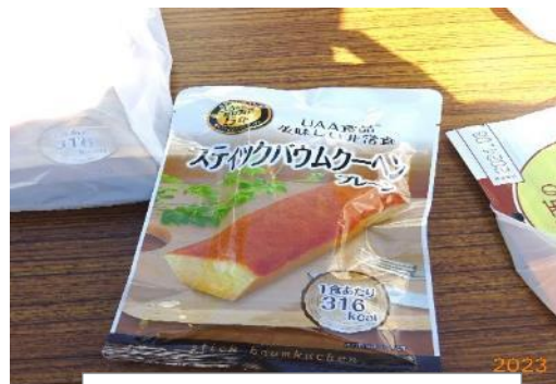
お子様用 非常食品のバームクーヘン