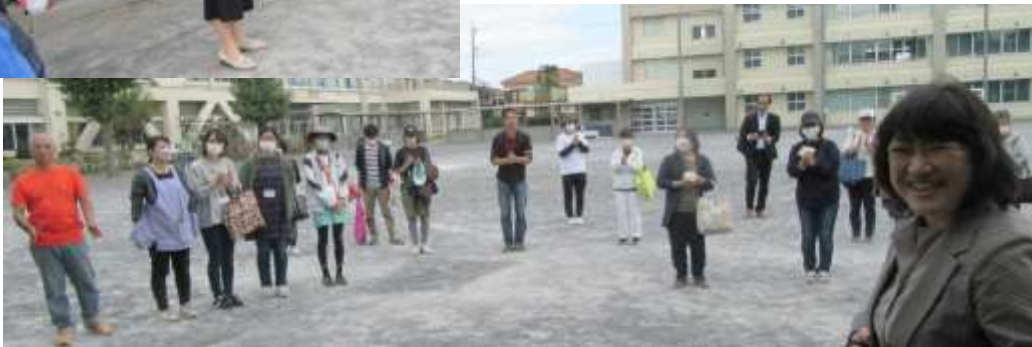
青少年対策第二地区の押本／内野からお手伝いの皆様へ御礼