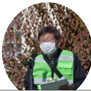
訓練説明 南街・桜が丘地域防災協議会 副本部長