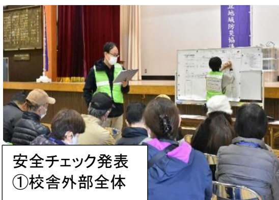
安全チェック発表 ①校舎外部全体