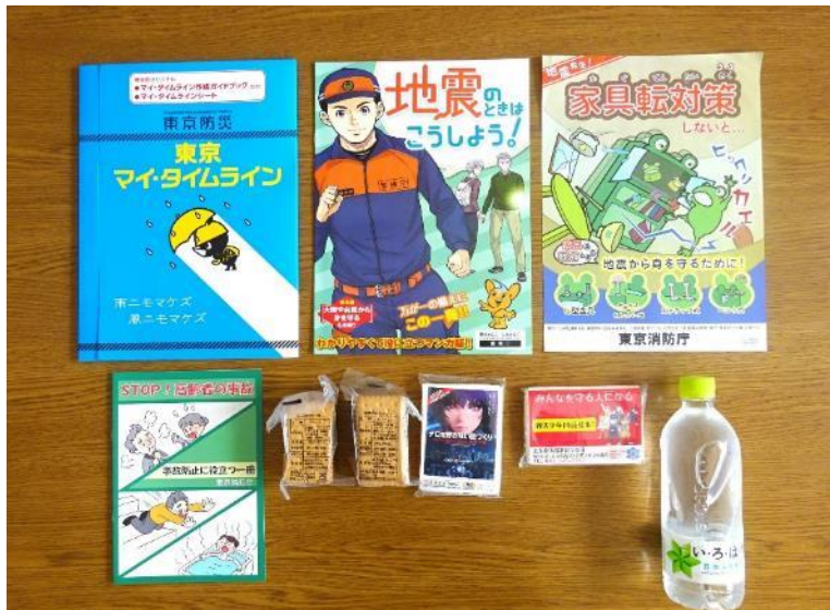
(参加賞の提供) 東大和市防災安全課様 北多摩西部消防署様 東大和警察署様 東京都様