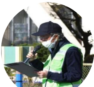
司会 南街・桜が丘地域防災協議会 副本部長