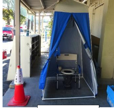
マンホールトイレ