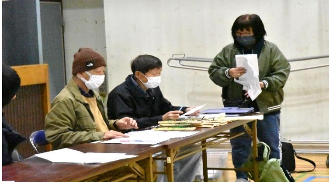
校内点検の分担を決める。