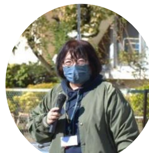
防災コーナー説明 南街・桜が丘地域防災協議会 「たんぽぽ」