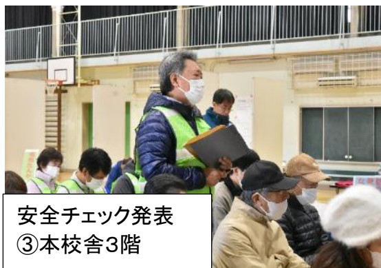
安全チェック発表 ③本校舎3階