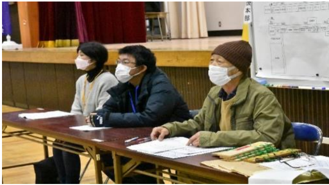
作業(校内点検)説明