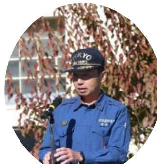
北多摩西部消防署 署長様