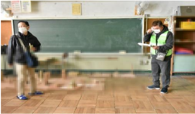
復旧班による ②本校舎1・2階 の点検のようす。