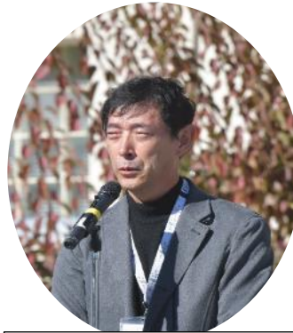
ご挨拶 東大和市立第二小学校 校長様