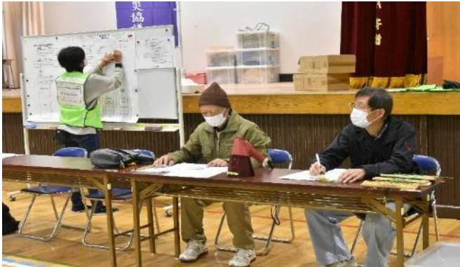
体育館(仮本部)に再度集合。 点検結果の報告・検討。