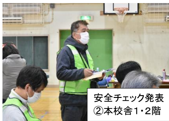
安全チェック発表 ②本校舎1・2階