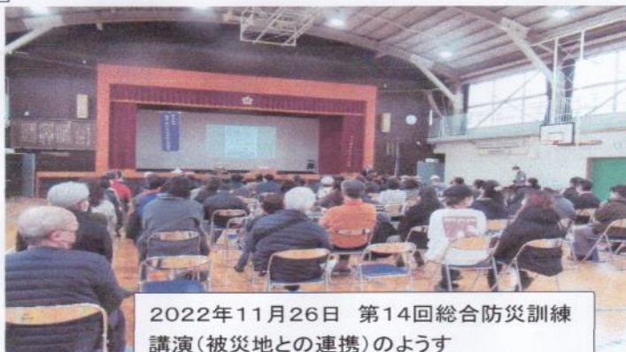
2022年11月26日 第14回総合防災訓練 講演(被災地との連携)のようす