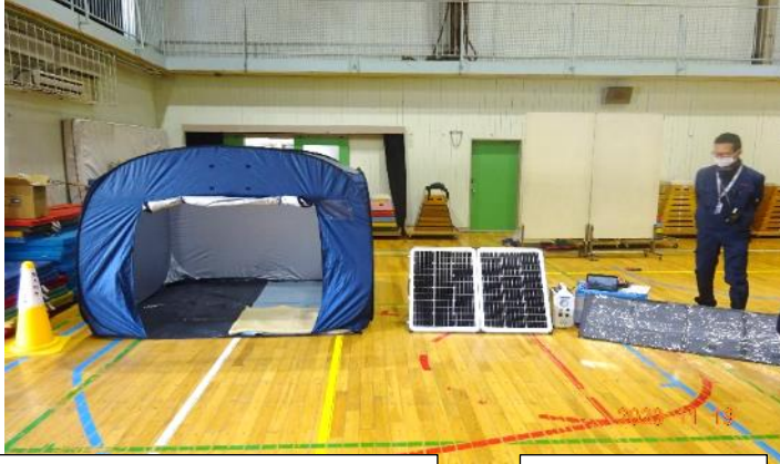
テント 屋根を除けば、パーティションに