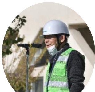
ご挨拶 南街・桜が丘地域防災協議会 本部長