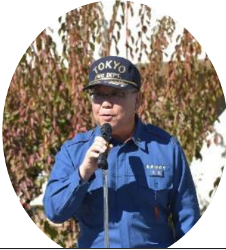
総評 北多摩西部消防署 警防課課長様