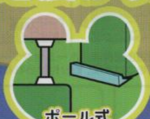
ボール式 + ストッパー式