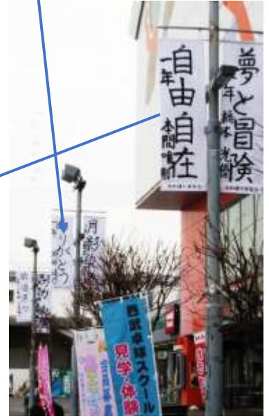
東大和市駅方向を見る