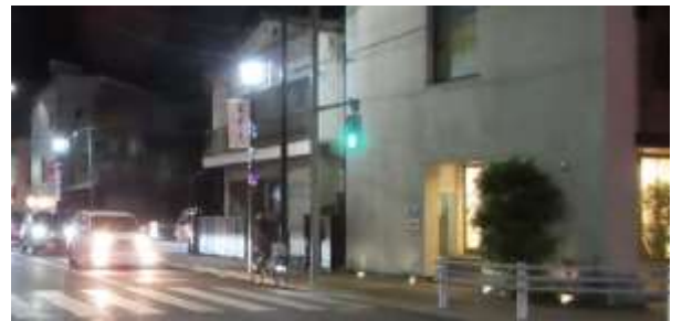
富士見通りの夜景(南街交番から西側)